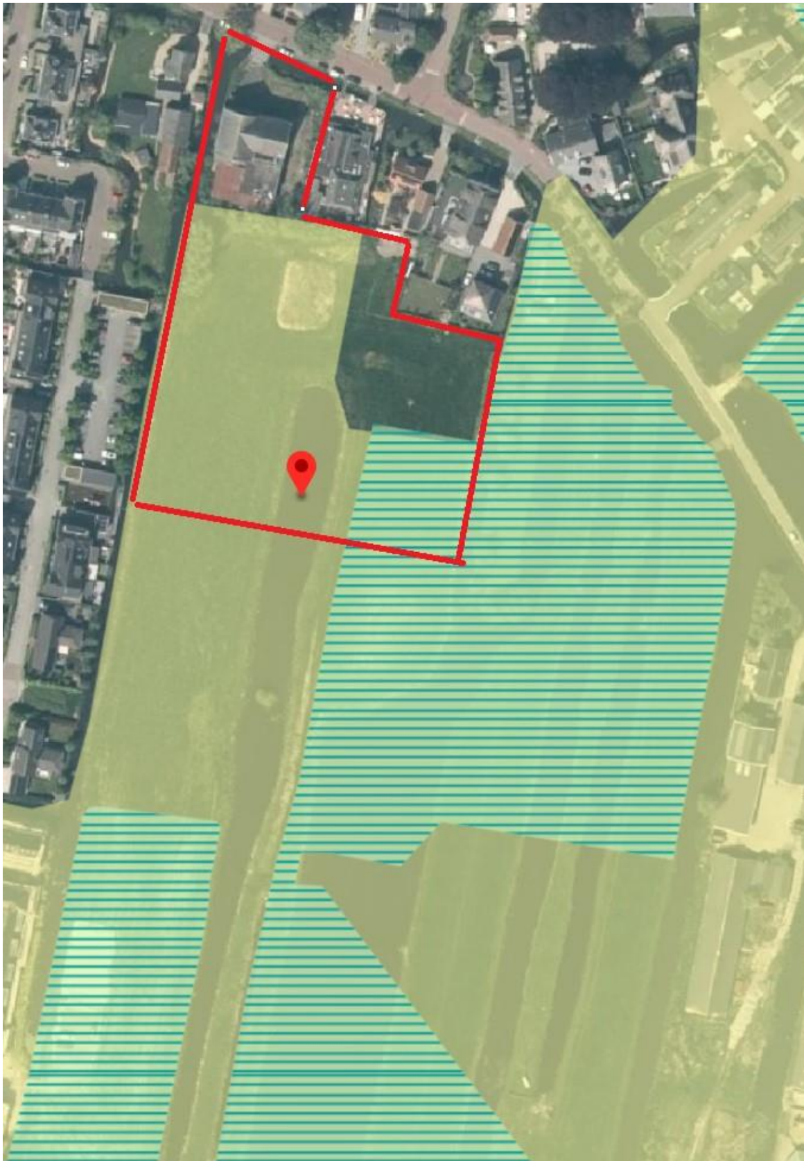
Figuur 2: Kaartbeeld ligging belangrijk weidevogelgebied nabij Reeuwijk-dorp en nieuwbouwlocatie