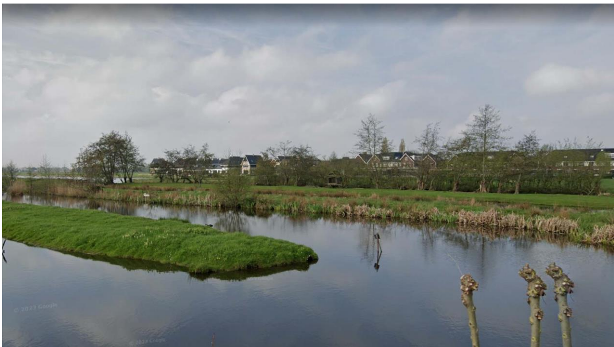
Figuur 4: Bomengroep vanaf de Nieuwdorperweg.