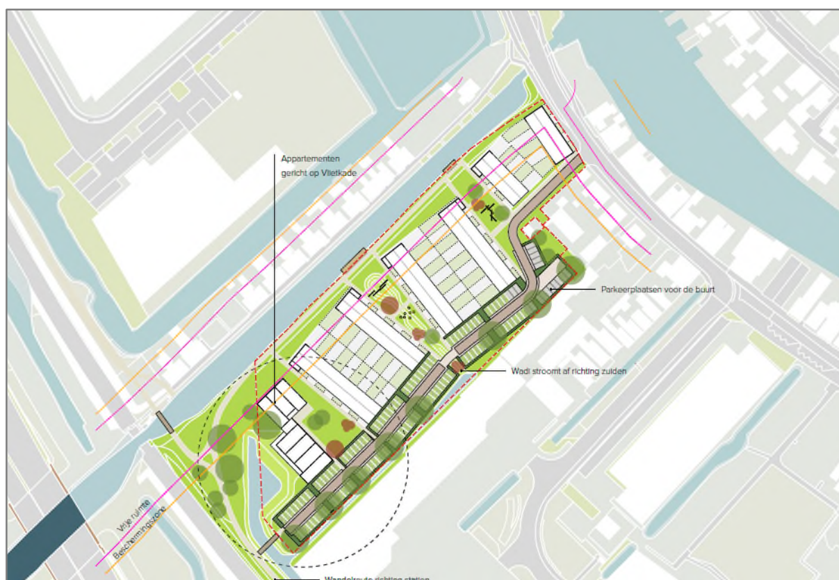
Figuur 3.1: Verbeelding van de beoogde situatie.

Het voornemen bestaat om het plangebied te herontwikkeling tot woningbouw. De bestaande bebouwing wordt gesloopt, verharding wordt verwijderd en beplanting wordt geroid. In totaal worden 46 grondgebonden woningen gerealiseerd en 28 appartementen. Nadien wordt er verharding aangelegd en wordt het plangebied landschappelijk ingepast door de aanplant van beplanting. De aanwezige opgaande beplanting en de droge sloot worden gehandhaafd. Figuur 3.1 geeft een verbeelding van de beoogde situatie weer.