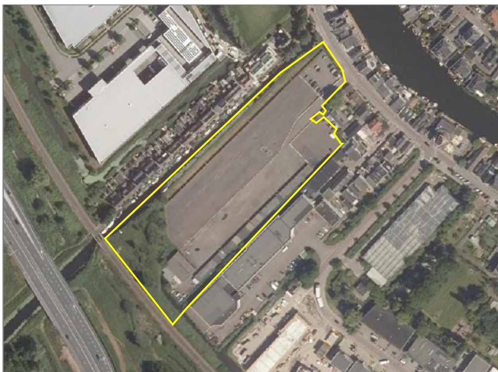
Figuur 2.2: Begrenzing van het plangebied.