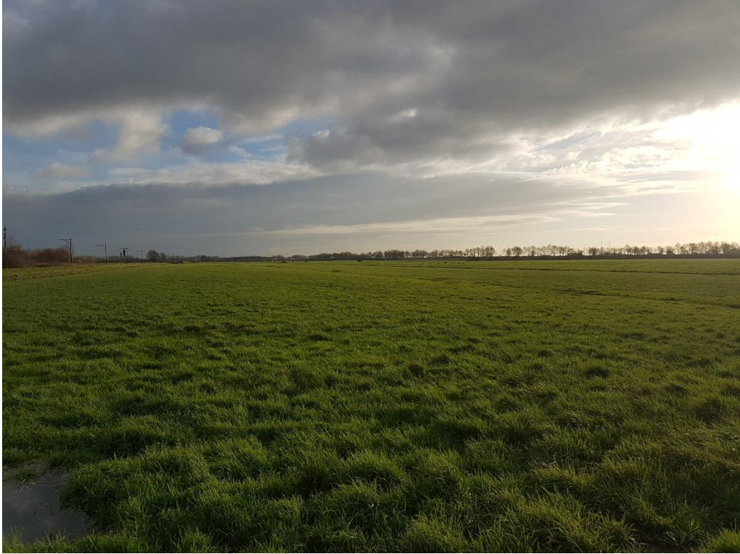
Figuur 1 Door de uitbreiding van het bouwblok wordt intensief beheerde weidegebied ontwikkeld.