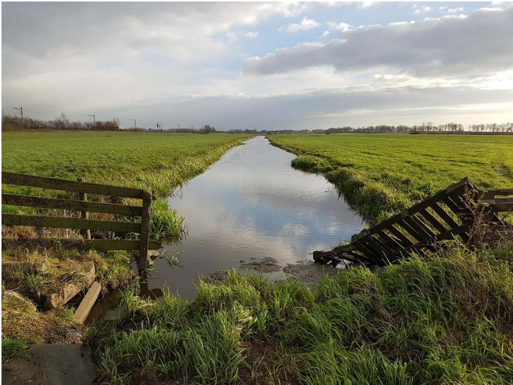
Figuur 2 Te dempen waterloop.