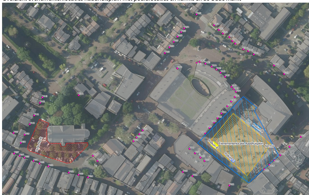
f4.1 Overzicht evenementenlocaties Raadhuisplein met podialocaties en kermis en de Oude Markt

In figuur 4.1 is de opstelling van verschillende podia en uitstralingsrichting van (muziek)evenementen op het Raadhuisplein weergegeven. Tevens is in deze figuur de evenementenlocatie ter hoogte van de Oude Markt en de kermis op het Raadhuisplein gearceerd weergegeven.