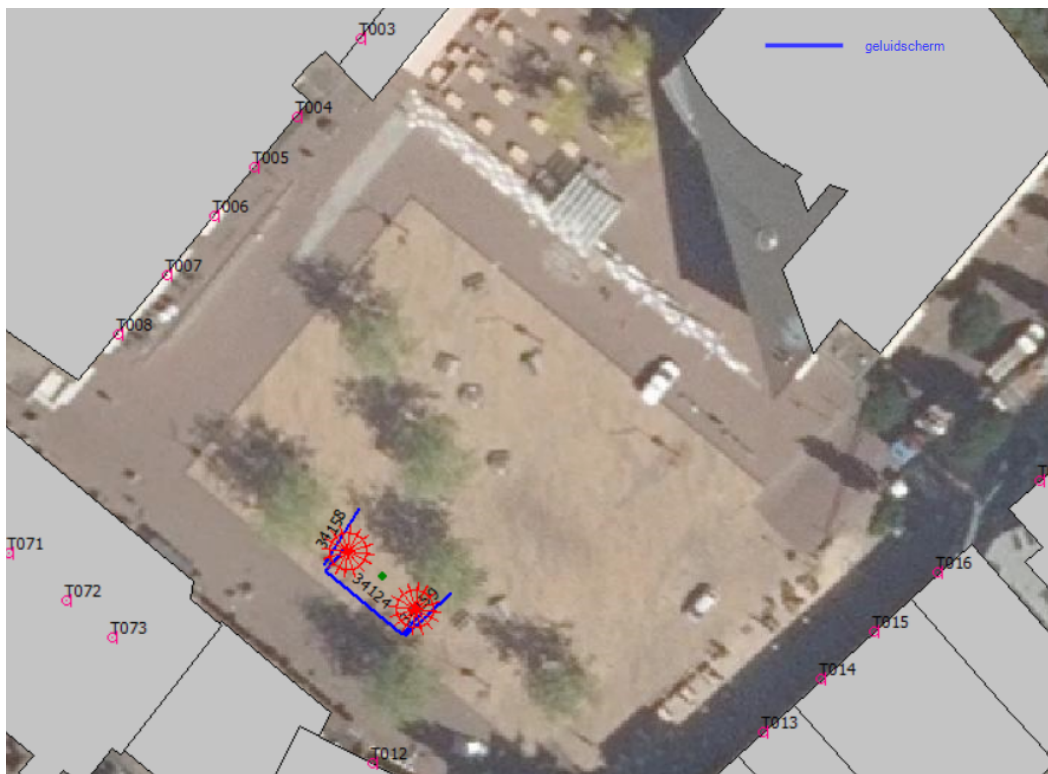
f7.2 Overzicht ligging podiumlocatie C met mogelijke geluidschermen aan de zijden

Uit de berekeningen blijkt dat met deze podiumlocatie in combinatie met line-arrays en geluidschermen en een geluidniveau van 90 dB(A) (SDS) op het publieksvlak een geluidbelasting op de gevel optreedt van 80 dB(A) en 95 dB(C). Een en ander leidt tot een binnengeluidniveau van circa 55 dB(A). Met deze combinatie van maatregelen is het aldus niet mogelijk geheel te voldoen aan een na te streven binnengeluidniveau van 50 dB(A). Echter, het binnengeluidniveau wordt wel gereduceerd ten opzichte van een grootschalig muziek-evenement op podiumlocatie A en B exclusief maatregelen. Op deze wijze lijkt een type IV evenement mogelijk. Gezien de beperkte verschillen tussen podiumlocatie A en C qua geluidoverdracht gelden deze resultaten eveneens voor podiumlocatie A.