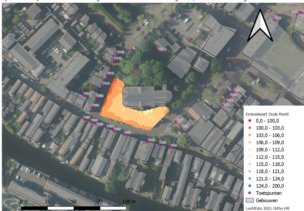
f7.3 Optimalisatie podiumlocaties ter hoogte van de Oude Markt te Bodegraven, zonder richtwerking

Uit figuur 7.3 blijkt dat ten zuiden van de kerk een eventuele podiumlocatie optimaal is qua ligging ten opzichte van de woningen gelegen om de Oude Markt. Hiertoe is een geluidvermogen van 98 à 104 dB(A) mogelijk, waarmee een geluidniveau van 70 à 75 dB(A) op het publieksvlak mogelijk is. Dit komt overeen met type I à type II evenementen. Verdere optimalisatie door een gunstige podiumoriëntatie (richtwerking) is in voorliggend onderzoek niet nader beschouwd.