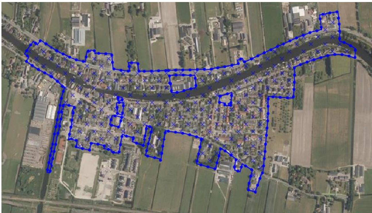
Figuur 1. Beheersverordening Kern Nieuwerbrug.

Het plangebied betreft het gehele gebied waarvoor de beheersverordening 'Kern Nieuwerbrug' van toepassing is (afbeelding 1).