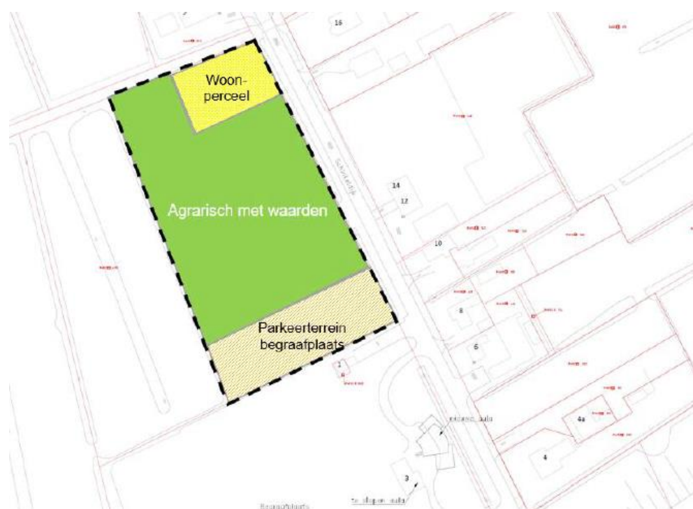
Fig. 1: Functieveranderingen ten noorden van de begraafplaats

In verband met een goed functioneren van begraafplaats Tempel en een veilig weggebruik van de daar gelegen polderweg Schinkeldijk heeft de gemeente Bodegraven-Reeuwijk in het recente verleden besloten, de begraafplaats van een aula en een parkeerplaats te voorzien. De beoogde parkeervoorziening heeft een omvang van 2000 m 2 en is gepland op weidegronden tussen de begraafplaats en een sierteeltbedrijf op het adres Schinkeldijk 11 a. Onderdeel van de planvorming is ook een wijzigingsbevoegdheid, waarmee ten zuiden van het sierteeltbedrijf de realisatie van één burgerwoning mogelijk wordt gemaakt.