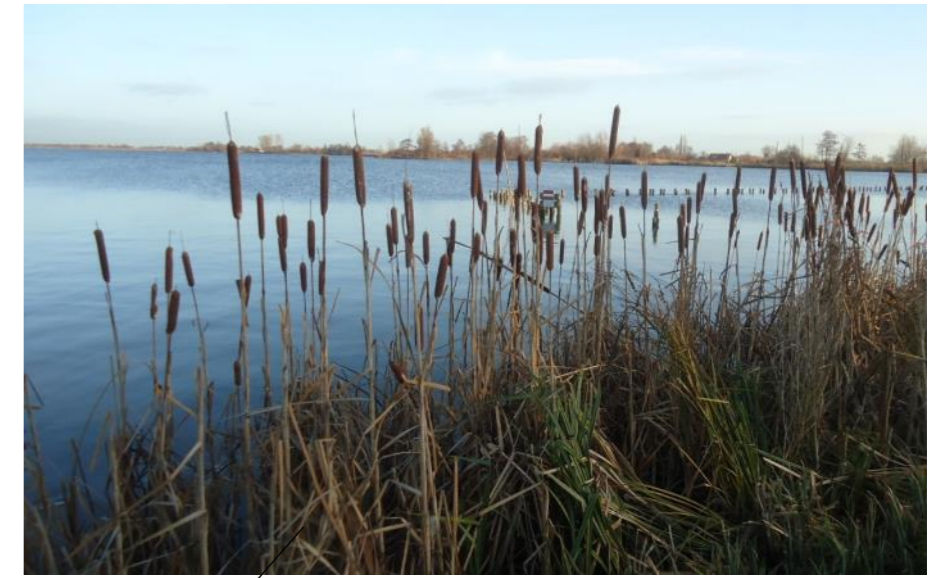
Winterbeeld natuurvriendelijke oever