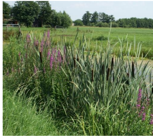
Zomerbeeld natuurvriendelijke oever met kattenstaart, rietsigaar en gele lis

De oevers worden opgetrokken uit duurzame Europese houtsoorten zoals paalhout van naaldhout of eiken aangevuld met manden die als golfbreker fungeren. Deze kunnen naar wens worden afgewerkt met een gezaagde plank van bijv. eiken of acacia. Op verschillende plaatsen per kavel wordt dit afgewisseld met een vooroever waarbinnen oevervegetatie de kans krijgt zich te ontwikkelen. Op voorhand worden hierin streekeigen soorten als lisdodde, kattenstaart en gele lis aangebracht. Een samenstelling van deze soorten geeft de oever zowel in zomer als winterseizoen een natuurlijk aanzicht. De vooroever heeft ook een golfbrekende werking waarbij de palenbeschoeiing niet of in een lichtere vorm kan worden aangebracht.