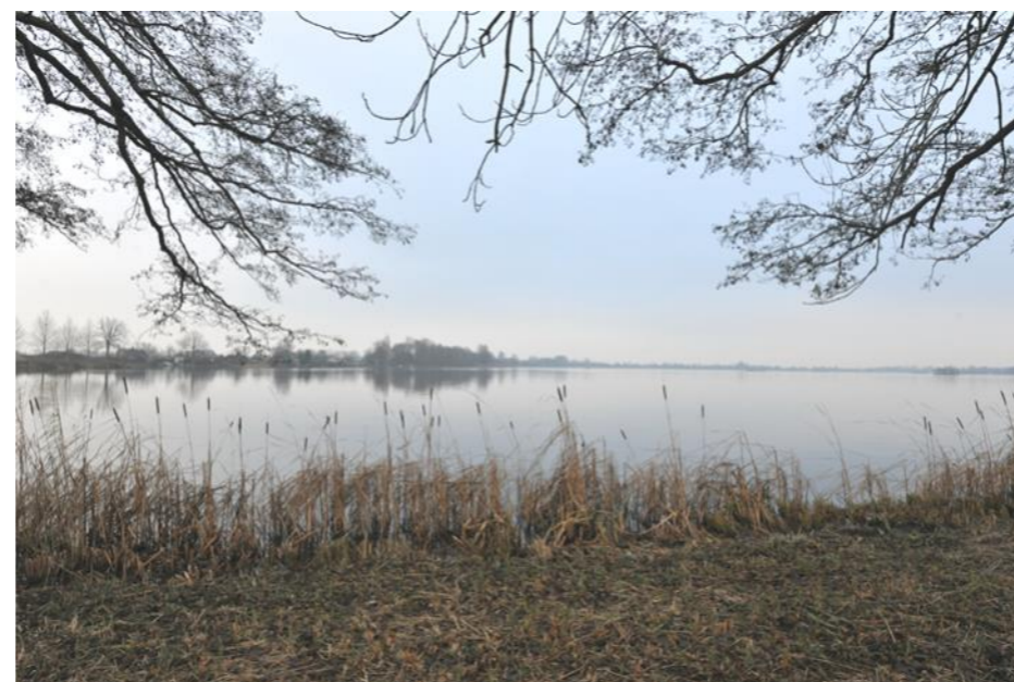
Natuurlijke uitstraling van verder weg en dichtbij, kenmerkend voor de Elfhoeveplas. Het is van belang het ontwikkelgebied te laten aansluiten bij dit sfeerbeeld.