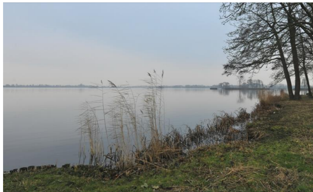
Winterbeeld natuurvriendelijke oever